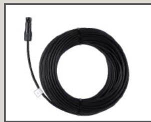
25 M CABLE CON CONECTOR MC4