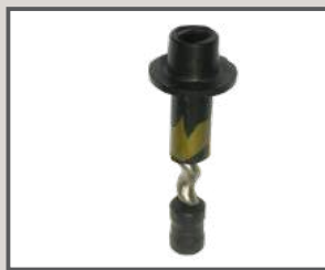
TORNILLO DE ACERO INOXIDABLE